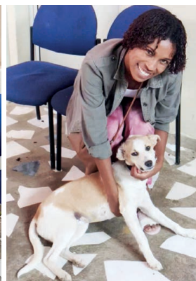
Viele Menschen kümmern sich sehr gut um ihre Tiere und bringen sie zur Behandlung und Operation zu uns.