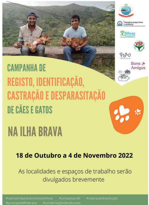
Das Plakat mit der Ankündigung unseres Einsatzes auf Brava

Bitte unterstützen Sie uns mit Ihrer Spende. Wir danken Ihnen herzlichst!