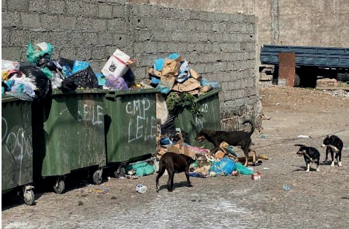
Streunende Tiere ernähren sich von allem, was sie finden können, sehr oft suchen sie ihre Nahrung im Müll.