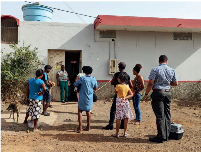
Jeden Tag in der Früh, wenn das Team kam, warteten schon etliche Menschen mit ihren Tieren vor der Tür.