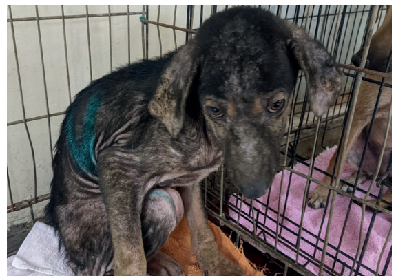
Ein Bild des Jammers – der kleine Ino litt an Räude, Unterernährung. Er wurde zur stationären Behandlung in die Klinik gebracht.

Verein Bons Amigos A-1020 Wien, Haidgasse 5/27