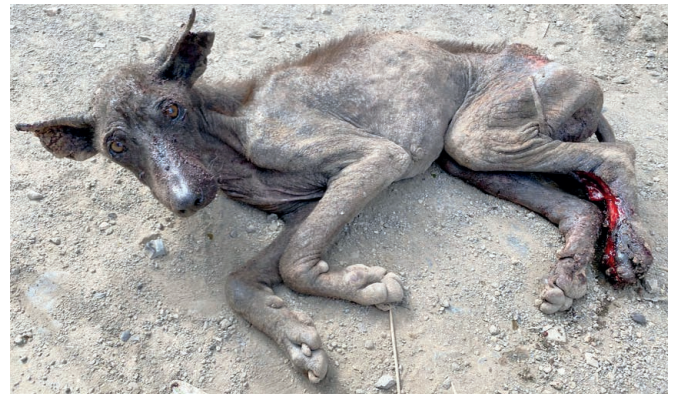
Diesen armen Kerl - geschwächt durch Hunger, die auszehrende Räude und eine Verletzung – fanden wir bei der Vorbereitung auf unsere Kampagne in Ponta d'Água. Die Bons Amigos arbeiten dafür, dieses Leid zu lindern und zu verhindern.

Als Vorbereitung für einen Operations- und Behandlungseinsatz ist es wichtig, den betreffenden Bezirk zu besuchen um die Situation dort besser zu kennen. Das dient natürlich auch dazu abzuschätzen, wie viele Tiere kastriert werden sollten oder unsere Hilfe brauchen werden und welche Krankheiten vorherrschen. Gleichzeitig nutzen wir die Gelegenheit, dabei mit der Bevölkerung und lokal tätigen Organisationen Kontakt aufzunehmen, um unseren Einsatz bekannt zu machen, ein passendes Lokal für unsere Arbeit auszuwählen und um freiwillige Helferinnen und Helfer zu finden. Dabei konnten wir in Ponta d'Água sehen, wie viele schwere Räudefälle es gibt!