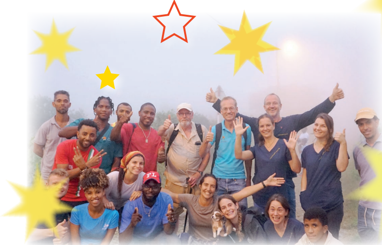
Das Team der Bons Amigos auf der Insel Brava im Oktober/November 2022

Os Bons Amigos desejam Feliz Natal e tudo de bom para o Proximo Ano de 2023!